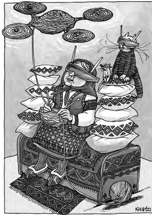
А це БПЛА, який для військових бабуся сплела...